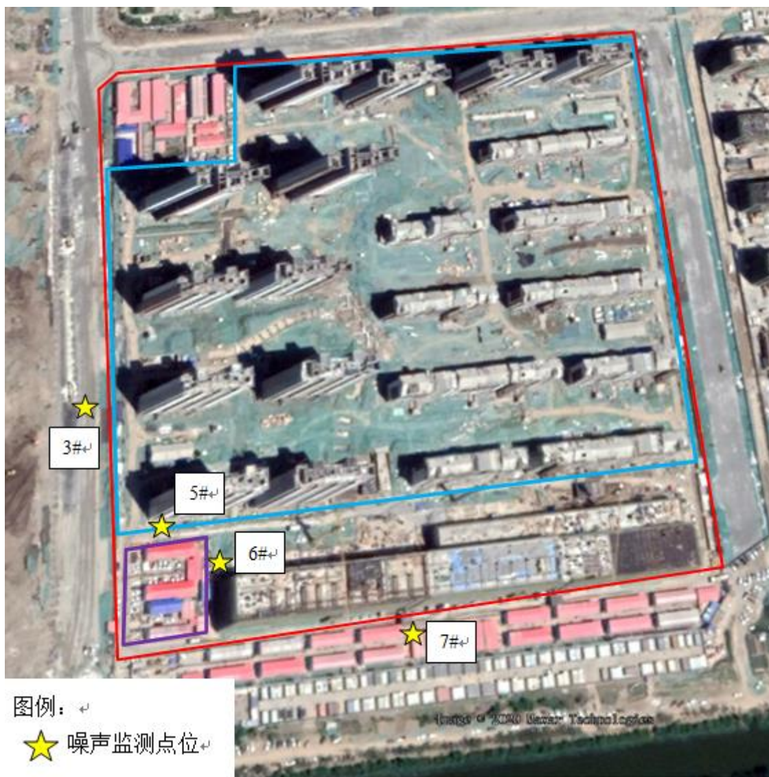
图 6-1 验收监测点位图